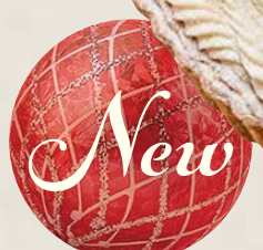
piece ¥ 1,198 whole (17cm) ¥ 6,814 whole (25cm) ¥ 14,601

特定原材料等(28品目中):卵・乳成分・小麦・ゼラチン・ 大豆・もも・オレンジ・りんご お酒使用の有無:香り付け程度