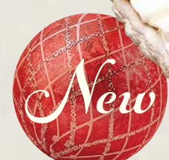
piece ¥ 1,490 whole (13cm) ¥ 5,734 whole (17cm) ¥ 8,413 whole (25cm) ¥ 15,120

特定原材料等(28品目中):卵・乳成分・小麦・ゼラチン・ 大豆・りんご・アーモンド お酒使用の有無:香り付け程度