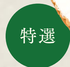
piece ¥ 1,998 whole (13cm) ¥ 7,614 whole (17cm) ¥ 11,210 whole (25cm) ¥ 20,196

特定原材料等(28品目中):卵・乳成分・小麦・ゼラチン・ 大豆・りんご お酒使用の有無:香り付け程度