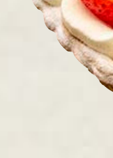
piece ¥ 1,674 whole (13cm) ¥ 6,415 whole (17cm) ¥ 9,428 whole (25cm) ¥ 16,956

特定原材料等(28品目中):卵・乳成分・小麦・ゼラチン・ 大豆・りんご お酒使用の有無:香り付け程度