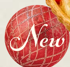
piece ¥ 1,393 whole (13cm) ¥ 5,378 whole (17cm) ¥ 7,884 whole (25cm) ¥ 14,148

特定原材料等(28品目中):卵・乳成分・小麦・ゼラチン・ 大豆・もも・オレンジ・りんご お酒使用の有無:香り付け程度