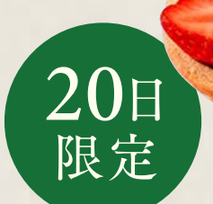
piece ————— ¥ 1,198 whole (25cm) ——— ¥ 12,204

特定原材料等(28品目中):卵・乳成分・小麦・ゼラチン・ 大豆・くるみ・アーモンド お酒使用の有無:使用ありません