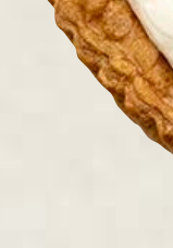
piece ¥ 896 whole (17cm) ¥ 5,151 whole (25cm) ¥ 9,180

特定原材料等(28品目中): 卵・乳成分・小麦・ゼラチン・ 大豆・りんご お酒使用の有無: 香り付け程度