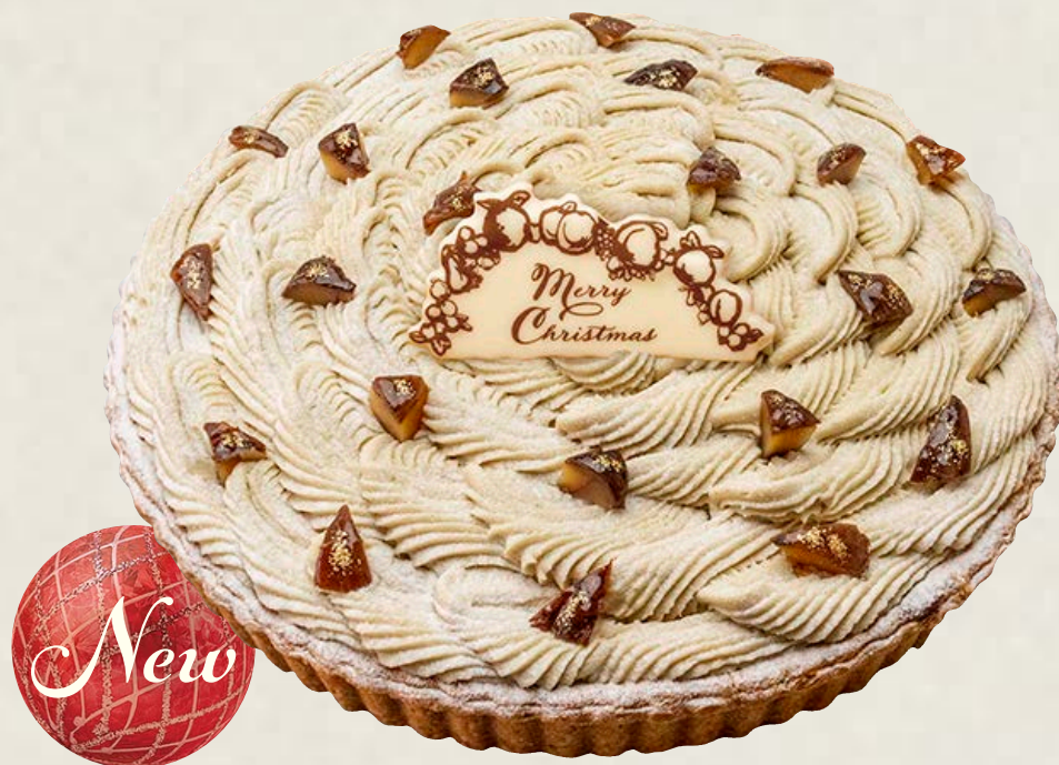
クリスマスモンブラン

特定原材料等(28品目中)：卵・乳成分・小麦・ゼラチン・大豆・もも・オレンジ・りんご お酒使用の有無：香り付け程度