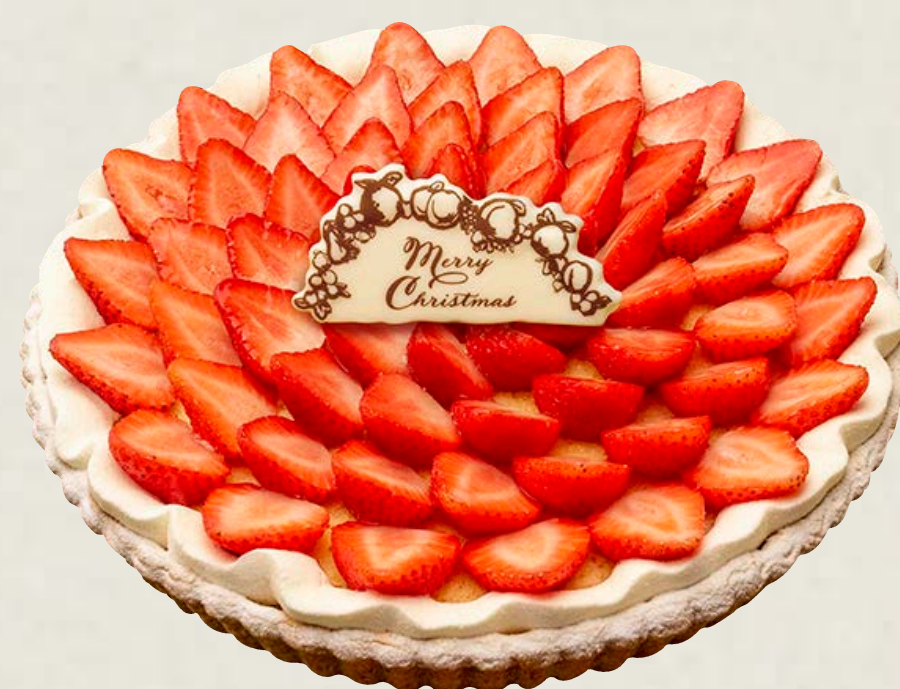
イチゴとフリルクリームのタルト ～ホワイトチョコ風味～

特定原材料等(28品目中)：卵・乳成分・小麦・ゼラチン・大豆・りんご お酒使用の有無：香り付け程度