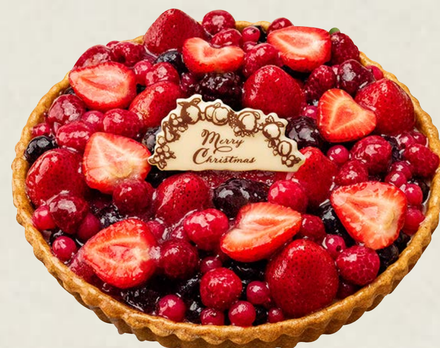
赤いフルーツのタルト ～リース仕立て～

特定原材料等(28品目中)：卵・乳成分・小麦・ゼラチン・大豆・りんご お酒使用の有無：香り付け程度