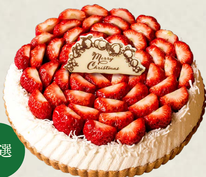
特選 静岡県産「紅ほっぺ」 のタルト～ホワイトチョコ風味～

特定原材料等(28品目中)：卵・乳成分・小麦・ゼラチン・大豆・りんご お酒使用の有無：香り付け程度