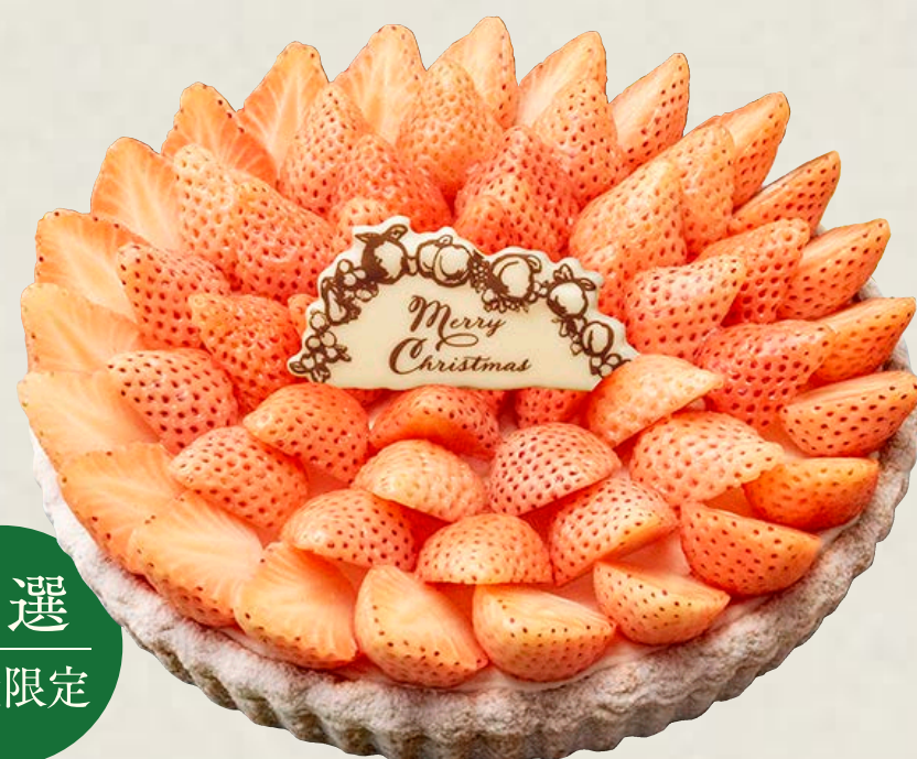
特選 “淡雪”のタルト

特定原材料等(28品目中)：卵・乳成分・小麦・ゼラチン・大豆・りんご お酒使用の有無：香り付け程度