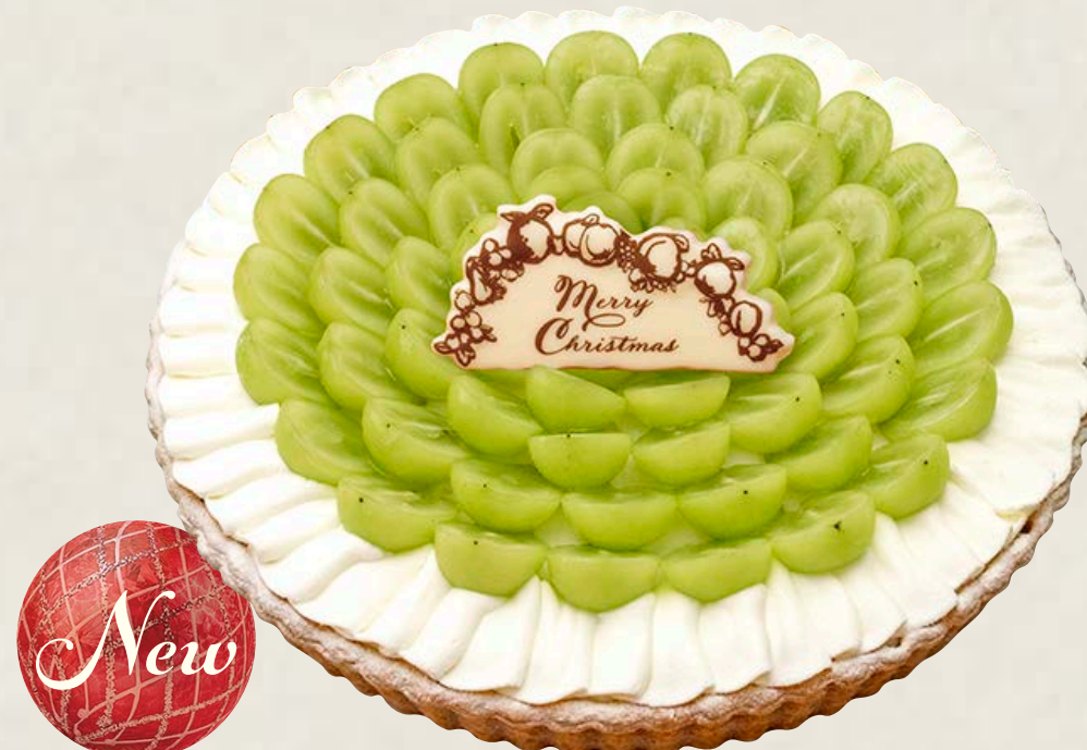
シャインマスカットとフリルクリーム のタルト～ホワイトチョコ風味～

特定原材料等(28品目中)：卵・乳成分・小麦・ゼラチン・大豆・りんご・アーモンド お酒使用の有無：香り付け程度