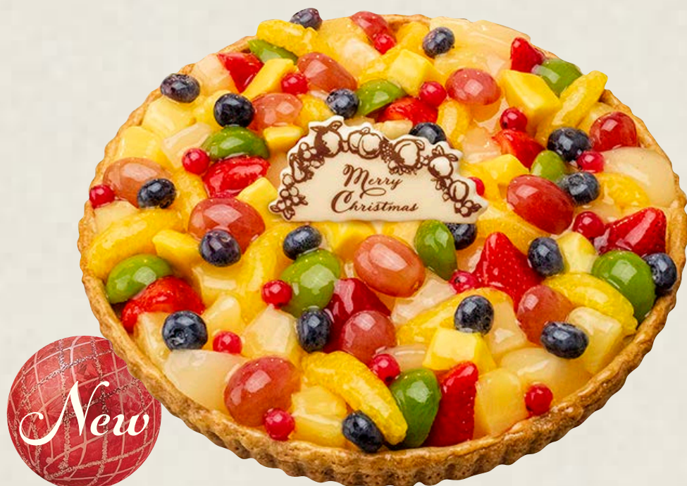
色とりどりのフルーツタルト ～ホワイトチョコ風味～

piece ————— ￥ 1,393 whole (13cm) ——— ￥ 5,378 whole (17cm) ——— ￥ 7,884 whole (21cm) ——— ￥ 10,951 whole (25cm) ——— ￥ 14,148