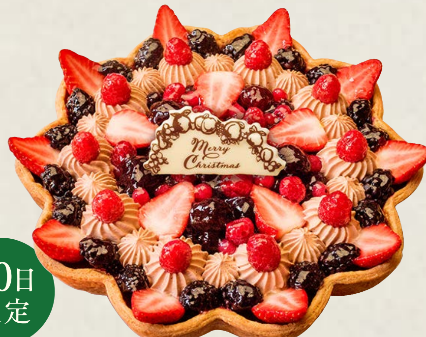
輪花型 ミックスベリーの キャンドルナイトケーキ

特定原材料等(28品目中)：卵・乳成分・小麦・ゼラチン・大豆・アーモンド・カシューナッツ お酒使用の有無：しっかり感じる程度